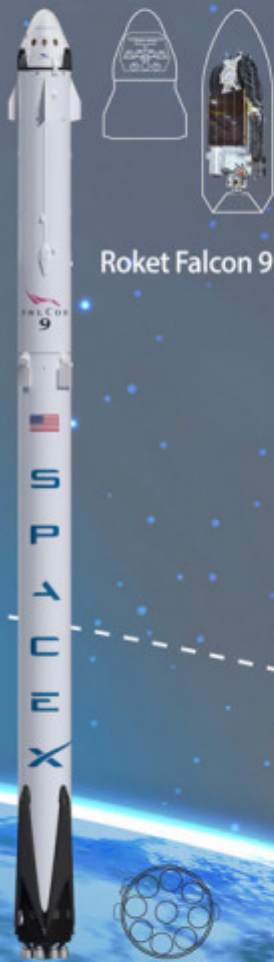
Roket Falcon 9